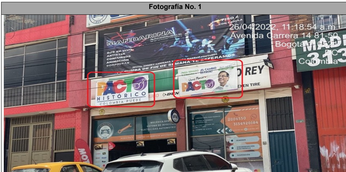
Foto Panorámica – Dos (2) Avisos con publicidad política instalados en la fachada del inmueble, sobre la KR 13 calzada oriental