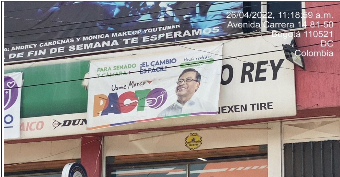
Un (1) Aviso en fachada con publicidad política.