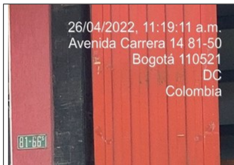
Nomenclatura del inmueble