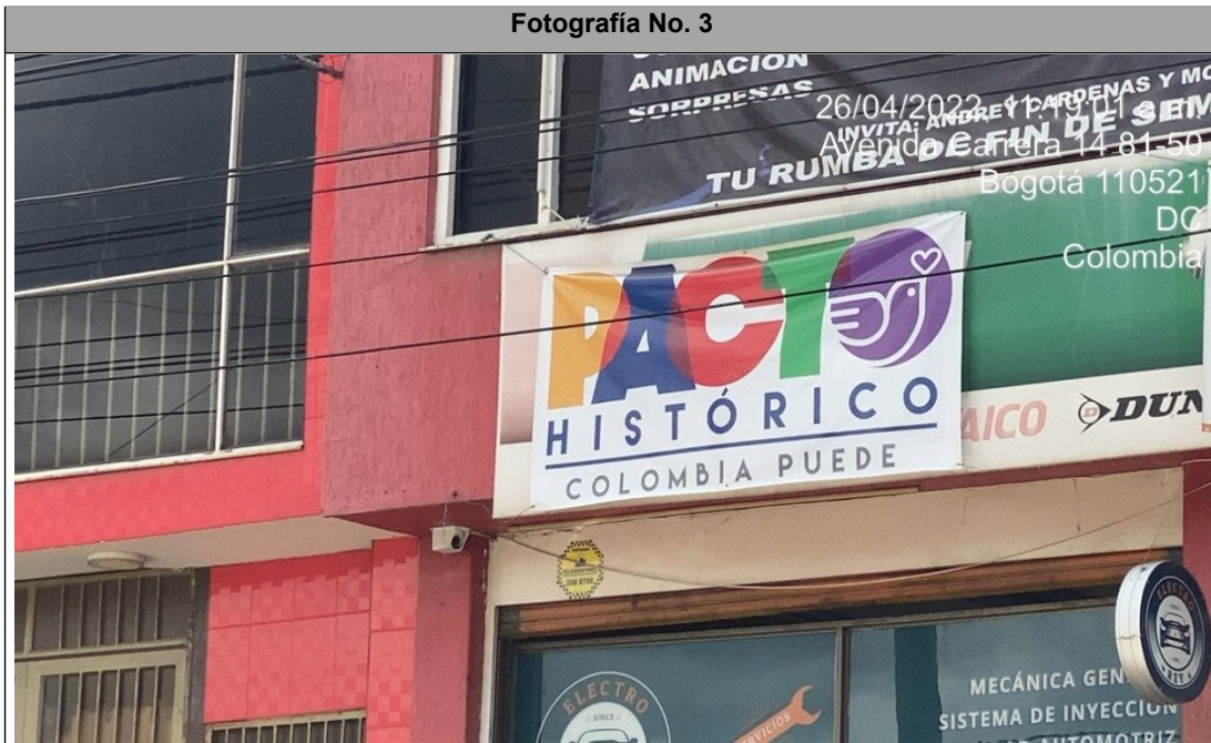
Un (1) Aviso en fachada con publicidad política, haciendo alusión al movimiento político mencionado anteriormente.